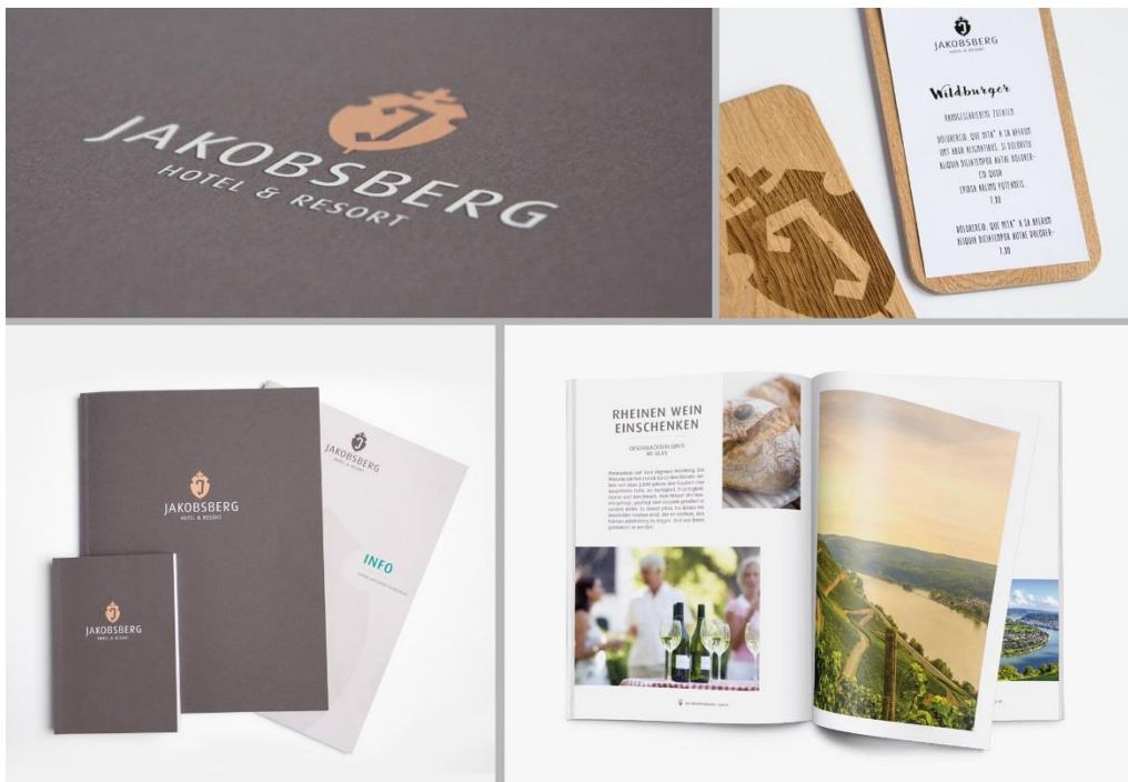
Neues Corporate Design: Logo, Menükarten, Geschäftsdrucksachen, Broschüren.