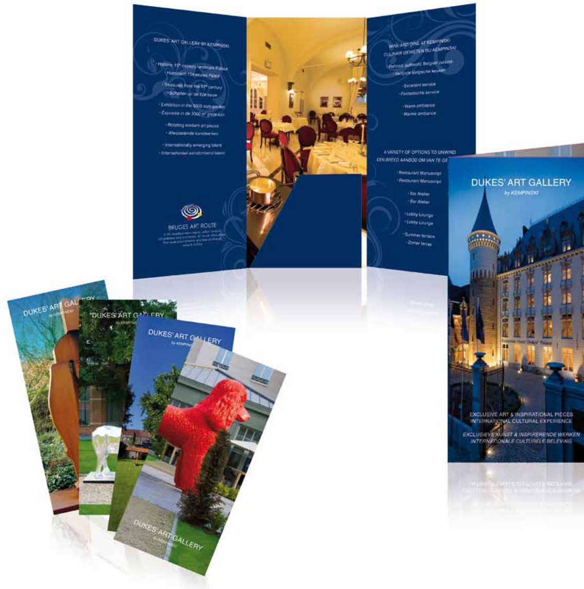
Dukes' Art Gallery