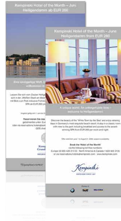
Hotel Of The Month - Flyer